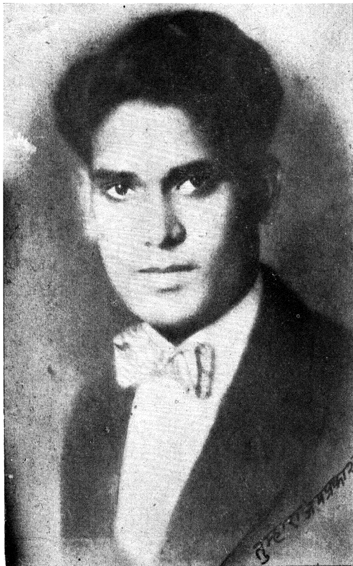
जयप्रकाश : अमेरिका का सभ्य छात्र